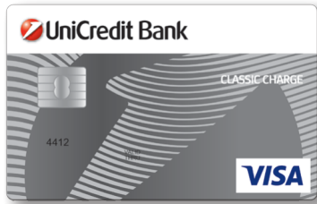
VISA Classic Charge kartica BIN: 441280