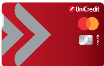
Mastercard Charge kartica BIN: 540942