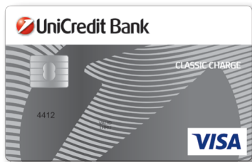
VISA Classic Charge kartica BIN: 441280