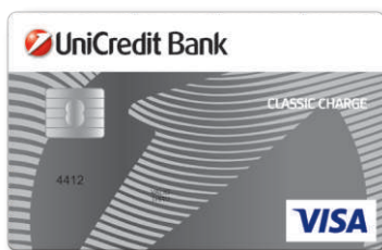
VISA Classic Charge kartica BIN: 441280