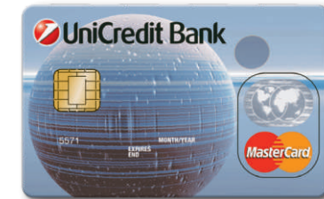
MasterCard Revolving BIN: 557105