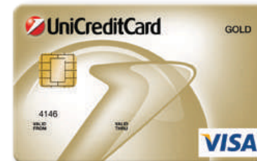
Zlatna VISA BIN: 414636