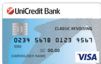
VISA Classic Revolving kartica BIN: 404867