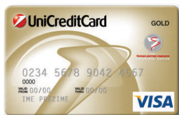
VISA Gold Komora doktora Revolving kartica BIN: 460043

» Uputa za korištenje EFT POS terminala na prodajnim mjestima.