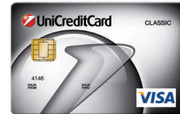
VISA Revolving BIN: 414637