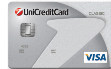
VISA Classic s odgodom plaćanja BIN: 433310

Napominjemo kako mogućnost kupovine roba i usluga putem obročne otplate mogu realizirati korisnici sljedećih UCB kartica: