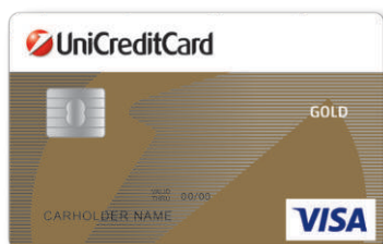
VISA Gold Revolving kartica BIN: 460043