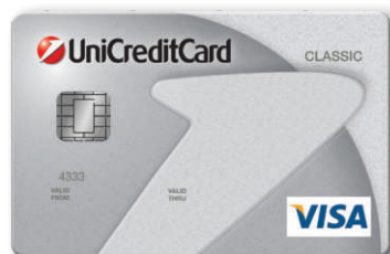
VISA Classic Revolving kartica BIN: 404867